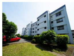
※図面と現況が異なる場合は現況優先といたします